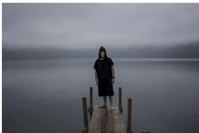
"Del sogno di Enea" Enrico QUATTRINI

«Una visione composita, legata da un'atmosfera misteriosa cromatismi crepuscolari, che restituisce un luogo, la sua mitologia e la sua evoluzione fino alla contemporaneità. L'opera, potenzialmente anti-narrativa marcata da un tempo sospeso e opaco, è frutto di uno sguardo personale in grado di interpretare i variegati e mutevoli volti di un tetro della nostra storia alla luce di un viaggio che ricomponne in un passato e presente.»