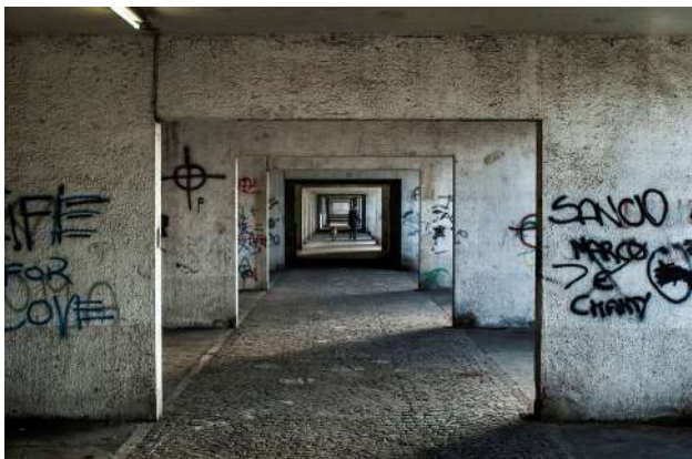
"Il Palazzo dei destini incrociati" Aldo FEROCCE

dignitosamente le loro esistenze in condizioni economiche, sociali, ed igienico-sanitarie che molti di noi troverebbero inaccettabili. Il complesso è stato protagonista o scenografia di molti film e progetti fotografici, e qui premiamo la forza espressiva e la grande e completa visione offerta dall'affresco progettuale dell'Autore, che fotografò la nascita del Corviale nel 1977 e che, a distanza di tanti anni, è tornato per documentare in modo non stereotipato l'umanità che lo popola.»