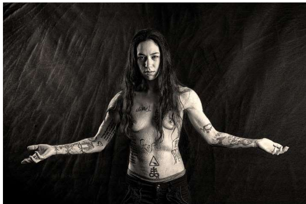
"Vietato morire " R.BUSETTINI & M.FERRERO

«Per la determinazione nel cercare e raccontare storie di donne ad un passo dalla morte. La sapienza compositiva e l'uso plastico della luce contribuiscono a evidenziare la forza e il lirismo di ogni ritratto.»