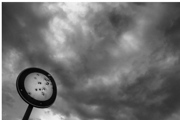
"Lo spazio incerto" Pierfranco FORNASIERI

«La linea di confine fra infanzia ed età adulta è un territorio incerto e a tratti spaventoso. Lo sguardo attento ma allo stesso tempo discreto di un padre che accompagna il figlio verso la scoperta di sé, il giocattolo abbandonato eppure esposto alla vista, lo sguardo di sfida e di presenza che si contrappone a un gesto di protezione, ci raccontano tutta l'ambivalenza di un'età dove ogni spigolo può ferire, poiché si è ancora carne tenera e totalmente esposta.»