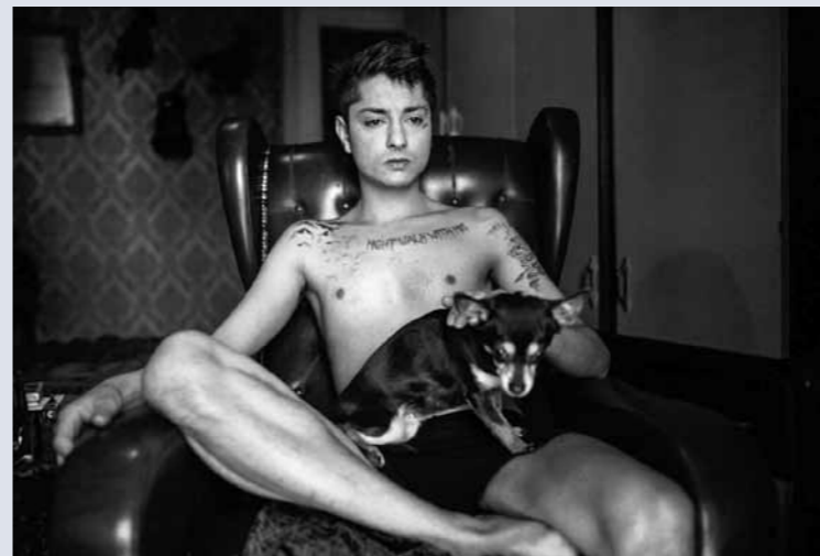
“Io sono Dario” di Gianluca Abblasio

Opera 1a classificata al PORTFOLIO DELL'ARIOSTO 2015 Premio FOSCO MARAINI per il Reportage al PORTFOLIO DELL'ARIOSTO 2015