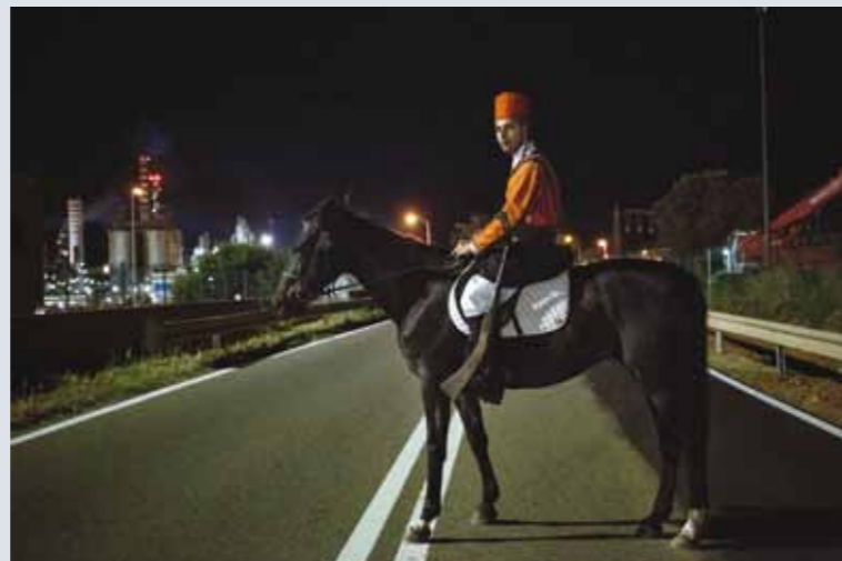
“Non ti scordar di me” di Daniele Pasci

Francesco Malavolta reca testimonianza non solo delle migrazioni in se, ma anche del loro evolversi con una peculiare attenzione verso i loro protagonisti. Ogni scatto, un racconto. Ogni racconto, una storia. Ogni storia, un tentativo di salvare la peculiarità della Vita ritratta sfuggendo alla logica spersonalizzante che presenta le migrazioni come “fenomeni idraulici” e anonimi. Le sue foto testimoniano inoltre la tenace determinazione di questi viaggiatori per necessità che abbandonano la propria vita e il proprio paese nella speranza di salvarsi e costruire una vita più degna. Nei suoi scatti troviamo quindi una umanità dolente che continua a lottare senza soccombere alle ingiuste umiliazioni cui viene esposta, una umanità caparbia che un passo alla volta guadagna centimetri di libertà.