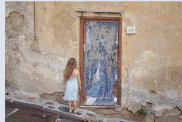
“Corrispondenze” di Ilaria Abbiento

Opera 2a classificata al PORTFOLIO DELL'ARIOSTO 2015