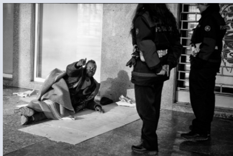
“Non ho attraversato il deserto per vivere in una piazza” di Giuseppe Vitale

“... Anche quelli che non soffrivano avevan l'aria abbattuta, e più l'aspetto di deportati che d'emigranti. Pareva che la prima esperienza della vita inerte e disagiata del bastimento avesse smorzato in quasi tutti il coraggio e le speranze con cui eran partiti, e che in quella prostrazione d'animo succeduta all'agitazione della partenza, si fosse ridestato in essi il senso di tutti i dubbi, di tutte le noie e amarezze degli ultimi giorni della loro vita di casa.” Edmondo De Amicis “Sull'Oceano”, 1889.