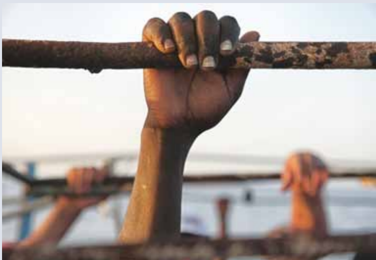
“Popoli in movimento” Oggi come ieri.

Francesco Malavolta reca testimonianza non solo delle migrazioni in se, ma anche del loro evolversi con una peculiare attenzione verso i loro protagonisti. Ogni scatto, un racconto. Ogni racconto, una storia. Ogni storia, un tentativo di salvare la peculiarità della Vita ritratta sfuggendo alla logica spersonalizzante che presenta le migrazioni come “fenomeni idraulici” e anonimi. Le sue foto testimoniano inoltre la tenace determinazione di questi viaggiatori per necessità che abbandonano la propria vita e il proprio paese nella speranza di salvarsi e costruire una vita più degna. Nei suoi scatti troviamo quindi una umanità dolente che continua a lottare senza soccombere alle ingiuste umiliazioni cui viene esposta, una umanità caparbia che un passo alla volta guadagna centimetri di libertà.