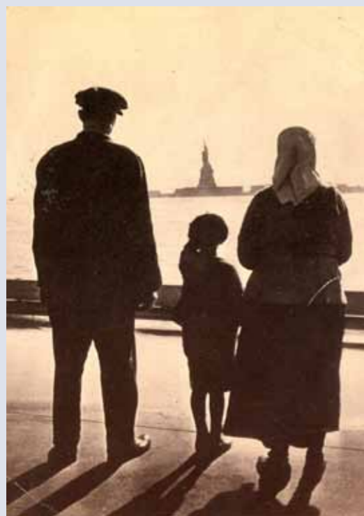
New York 1900

Opera segnalata al PORTFOLIO DELL'ARIOSTO 2015 sez. Circolo Fotocine Garfagnana