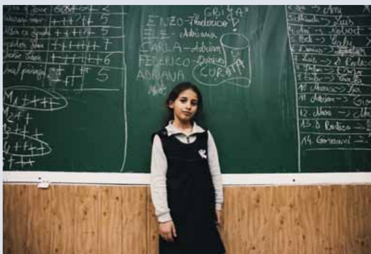
“Unchildren” di Eleonora Carlesi

Opera segnalata al PORTFOLIO DELL'ARIOSTO 2015