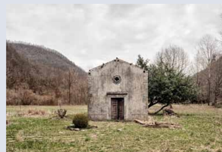
“Formae temporis” di Simone Letari

Opera segnalata al PORTFOLIO DELL'ARIOSTO 2015