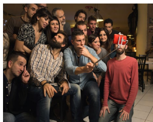
Da "Rumore Bianco"

Sabato 1 Febbraio ore 17,30 - Sala Suffredini